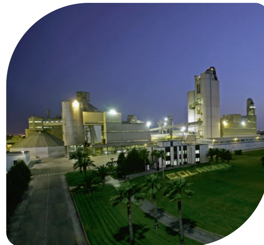
Bilancio Consolidato 2006

Direzione Generale: Gubbio - Perugia - Italia Tel. +39 075 92401 - Fax +39 075 9276676 www.financo.it - info@financo.it